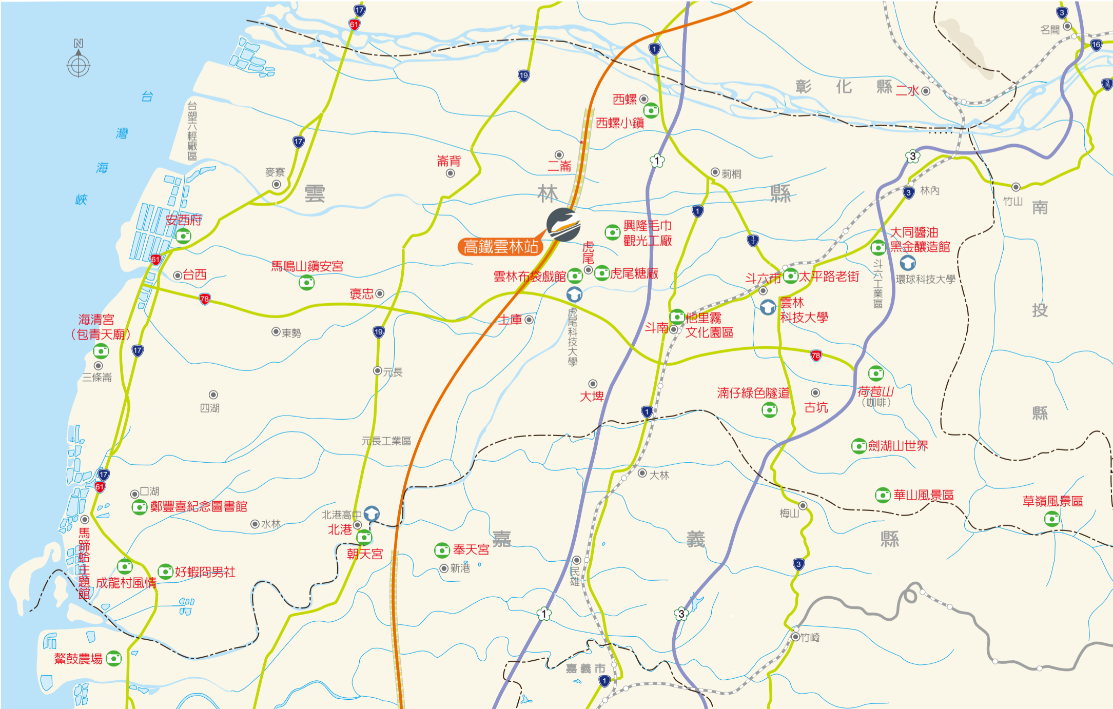
●本地圖非依比例尺繪製